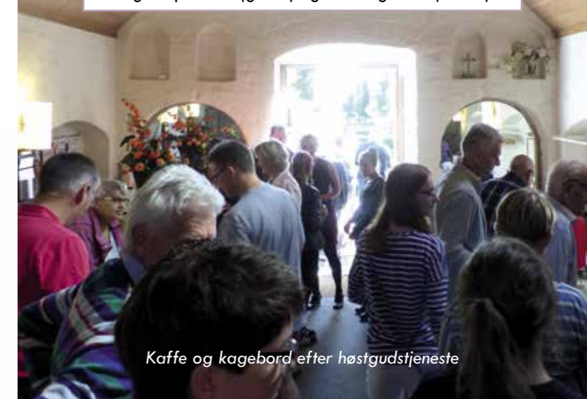
Kaffe og kagebord efter høstgudstjeneste

Kirkebil kan bestilles på 7550 2700 til gudstjenester (gratis) og Onsdagscafé (20 kr.)